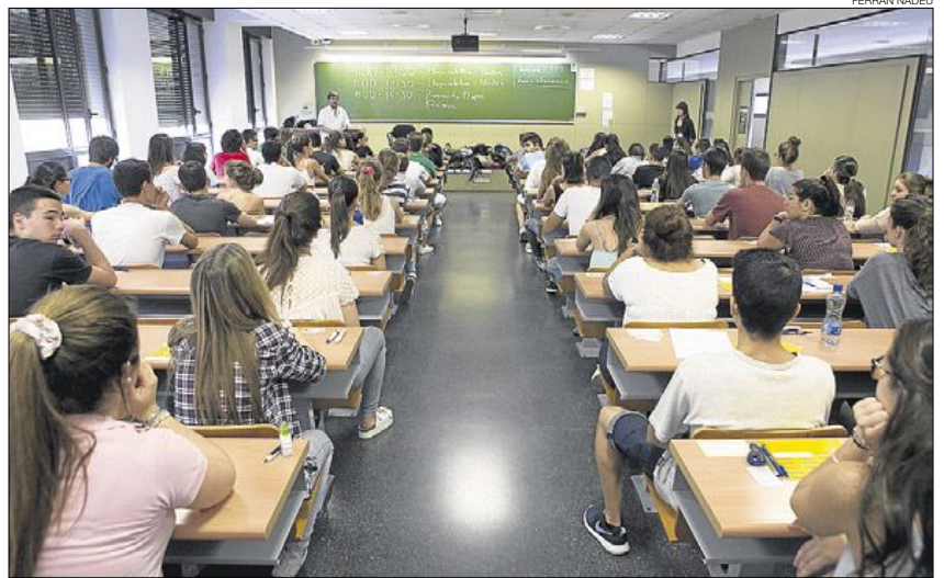
► Pruebas de acceso a la universidad en un aula de la facultad de Ingeniería de la UAB, en junio pasado.