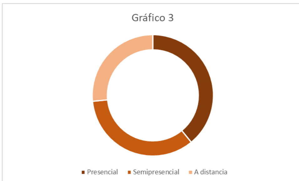
Gráfico 3. Oferta para el curso 2023/2024 según modalidad de impartición