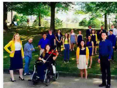
Estudiantes premiados con una beca Hefesto. EM

Y todo, además, sin la posibilidad de hacer fichajes de profesores nacionales o extranjeros, que requieren recursos salariales, materiales o de espacios físicos, y con dificultades para garantizar una línea de continuidad que permita sustituir a los profesores veteranos por otros más jóvenes para consolidar los grupos de investigación en temas especializados. El rector de la Universidad de Cantabria lamenta, en este sentido, que «en España nunca se ha podido tener un sistema con la suficiente flexibilidad para competir en el mercado de la ciencia», y advierte del riesgo de confiar en la vocación o la voluntad para conseguir retener al personal docente.