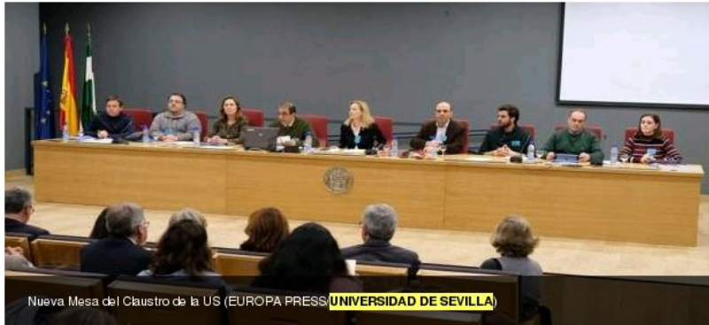
Nueva Mesa del Claustro de la US (EUROPA PRESS) UNIVERSIDAD DE SEVILLA