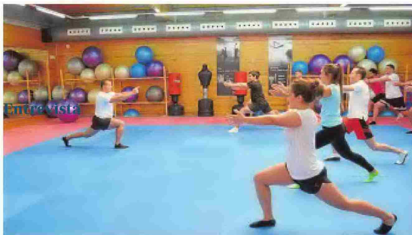
Son todas sesiones dirigidas por monitores especializados