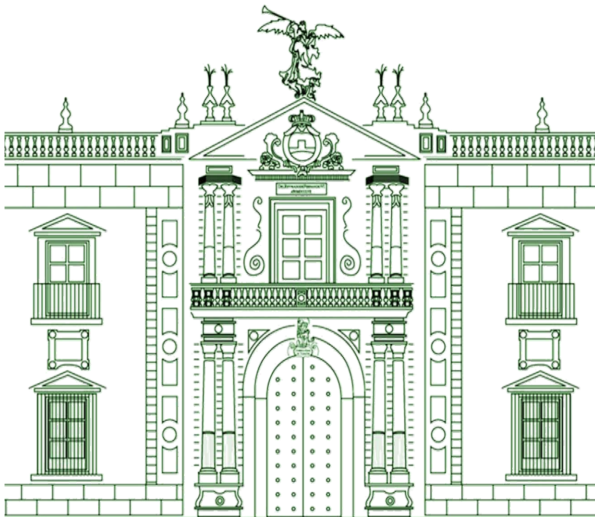
ANEXO III. Tarifas.