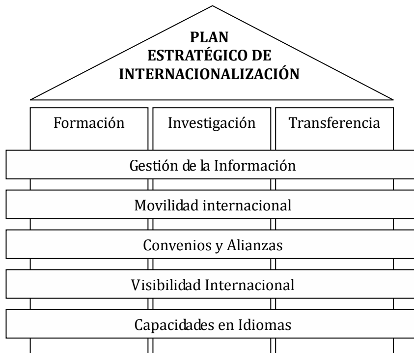
Figura 3: Plan estratégico de Internacionalización de la Universidad de Sevilla

De acuerdo con los planteamientos anteriores, el plan estratégico de internacionalización de la Universidad de Sevilla se estructura en forma matricial, integrado por ocho grandes líneas de actuación: tres de naturaleza vertical y cinco de tipo trasversal. Las líneas verticales hacen referencia a las tres grandes funciones que desempeña la universidad en la actualidad, (a) la formación, (b) la investigación y (c) la transferencia de conocimiento dentro del sistema de I+D+i. Por su parte, estas tres áreas fundamentales requieren de un conjunto de medidas de apoyo continuo que configuran las líneas transversales. Estas cinco líneas hacen referencia a (1) la creación de un sistema de gestión de la información para la internacionalización, (2) la potenciación de la movilidad internacional, (3) la gestión de convenios y alianzas estratégicas internacionales, (4) la mejora de la visibilidad y reputación internacional de la Universidad de Sevilla y (5) la mejora de las capacidades interculturales y en idiomas por parte de toda la comunidad universitaria (ver figura 3).