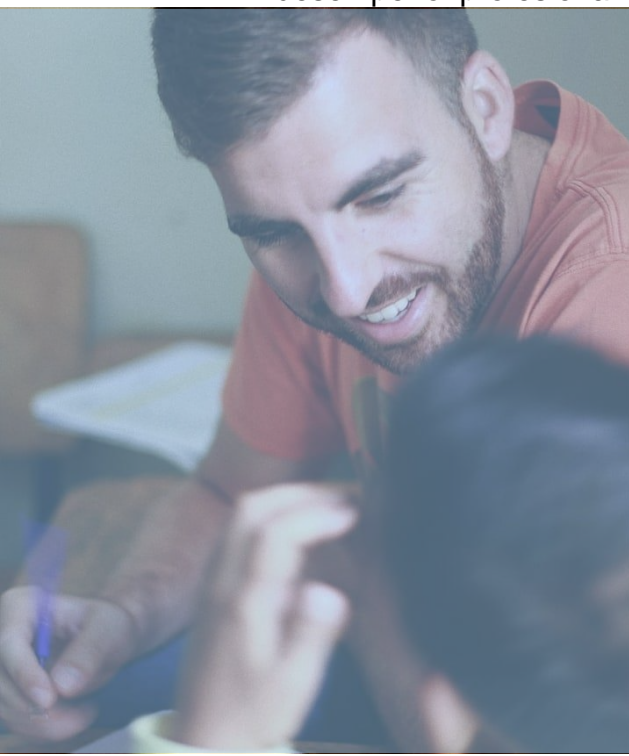
Voluntariado Internacional de la Universidad de Sevilla 2019. Honduras. Proyecto: Edúcame Primero

Se fortalecerán los mecanismos de reconocimiento y de conciliación con el desempeño profesional y académico de la comunidad universitaria, con especial atención al PAS, para impulsar así su implicación en actividades de cooperación para el desarrollo y EpDCG.